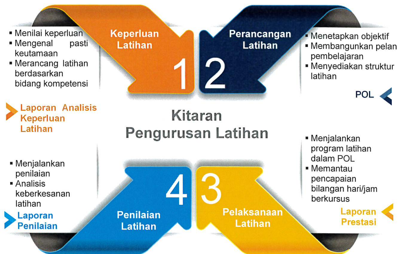
Rajah 2: Kitaran Pengurusan Latihan