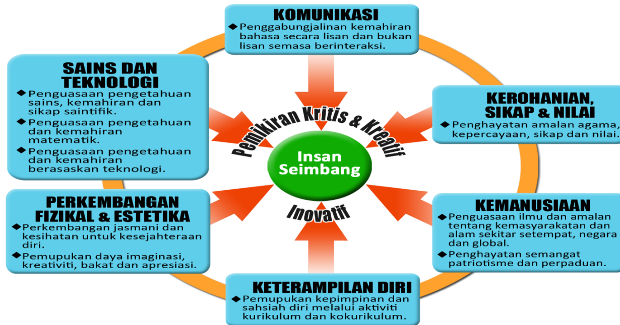
Bentuk Kurikulum Transformasi